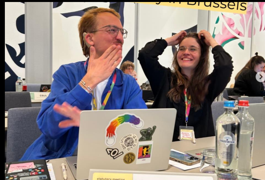
European Youth Forum