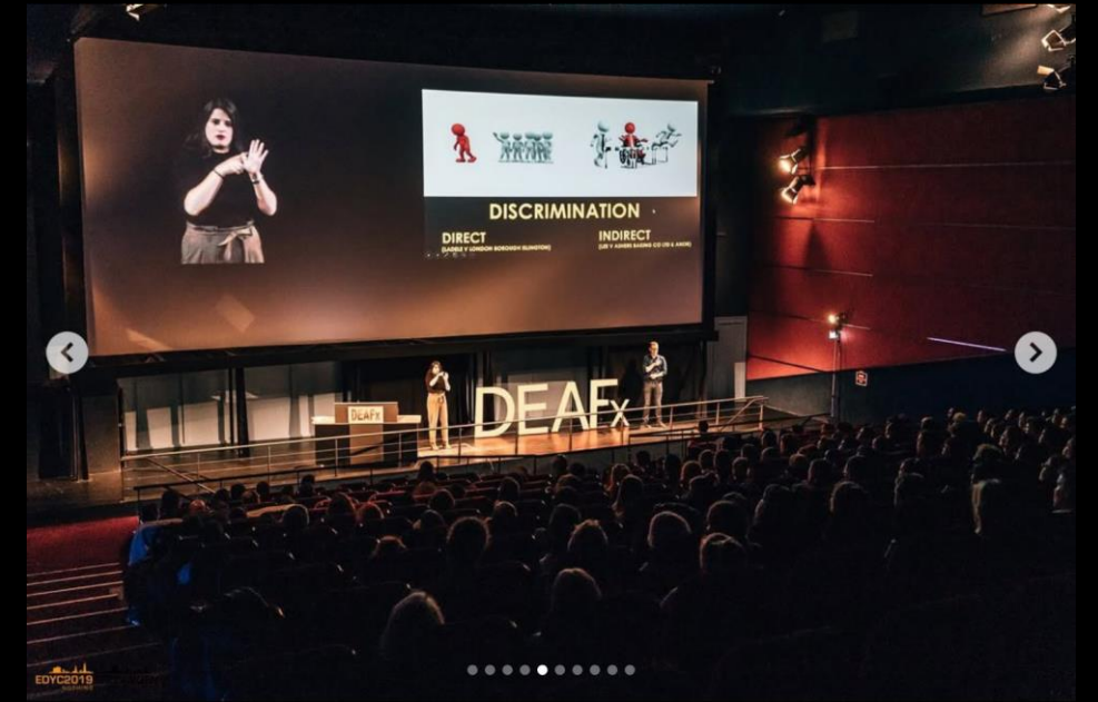
European Deaf Youth Capital (EDYC)