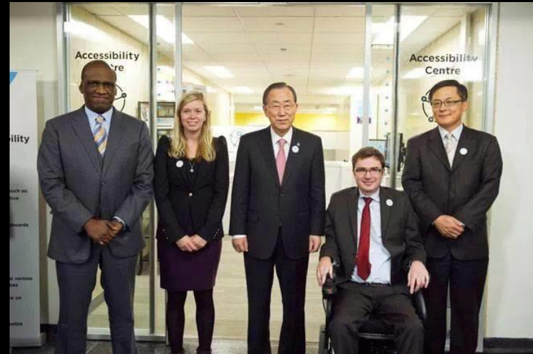
Meeting UN Zentrale