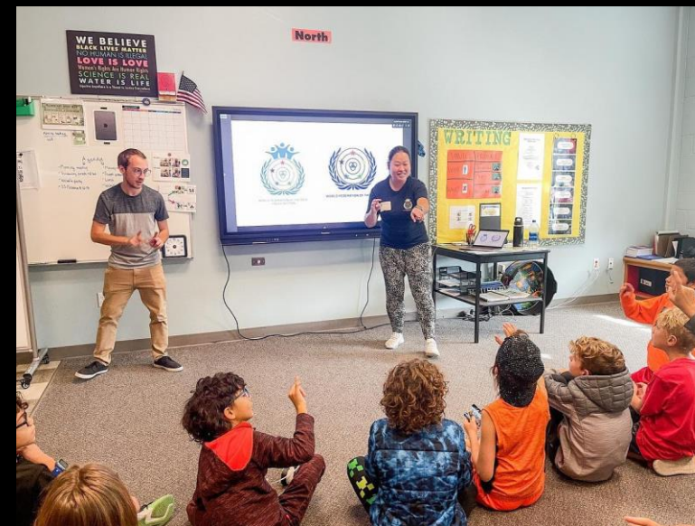
Workshop mit Kindern