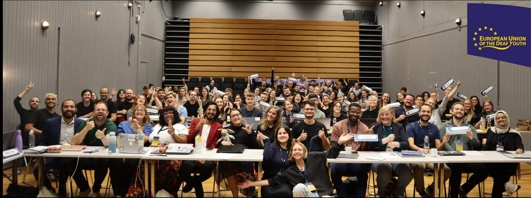
EUDY General Assembly