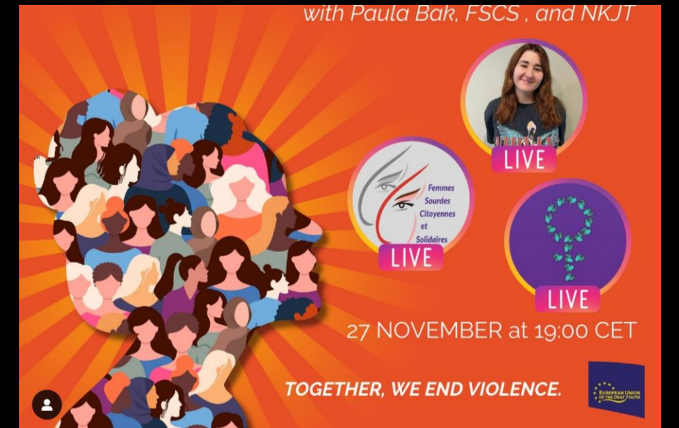
Presentation/Interview on Instagram LIVE