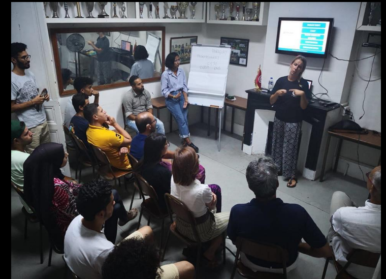
Workshop mit Tunesischer Jugend