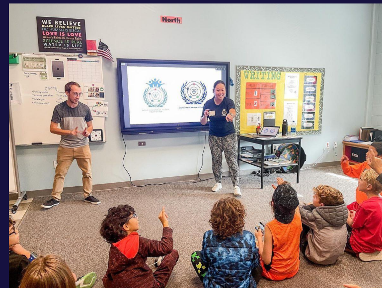
Laboratori con i bambini