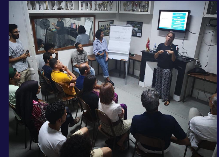
Workshop con i giovani tunisini