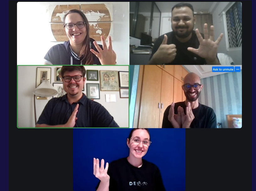
Riunioni online del Consiglio di WFDYS