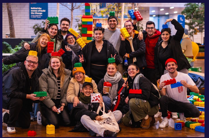
Lavori di gruppo