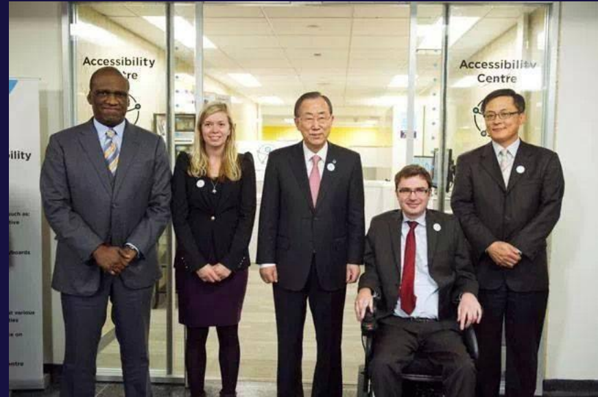
Incontri presso la sede delle Nazioni Unite