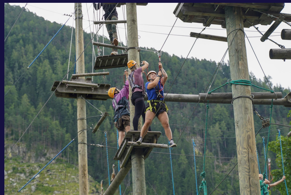
Attività dell'EUDY Camp