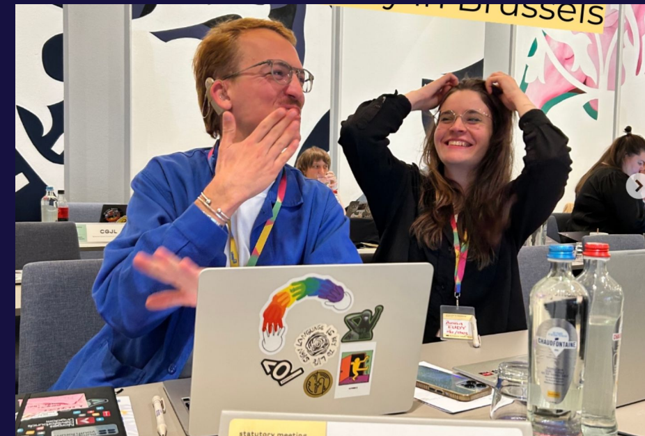
European Youth Forum