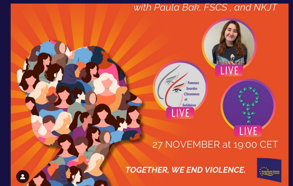
Presentazione/Intervista in diretta su Instagram