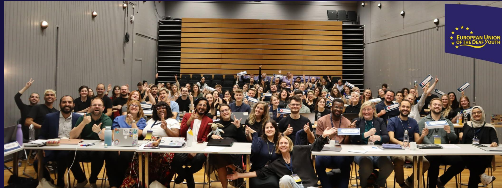
Assemblea generale dell'EUDY