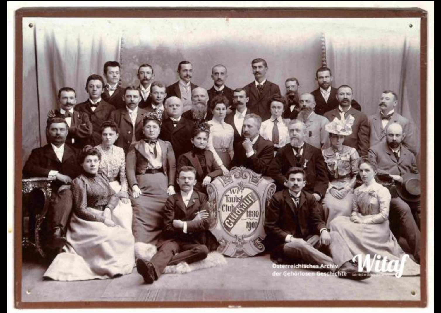
Viedenský klub pre nepočujúcich a nemých „Glück auf“ 1880 – 1900, oslavy 20. výročia