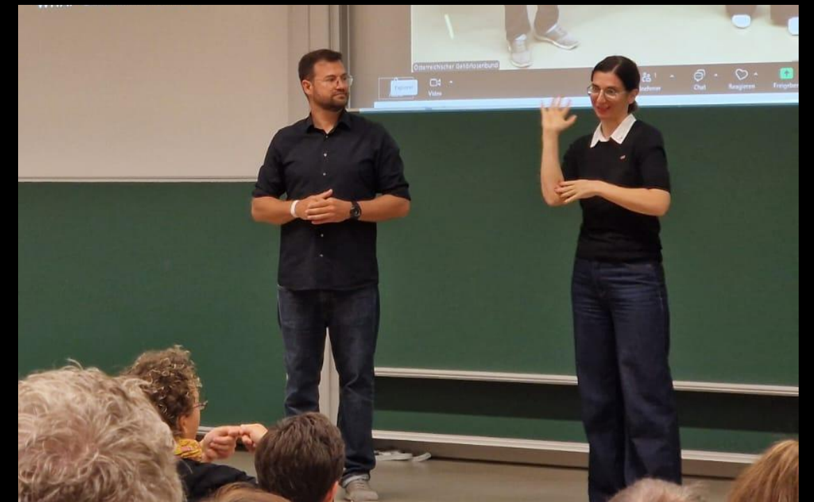
Vzdelávací kongres 2025 rakúskeho „Gehörlosenbund“