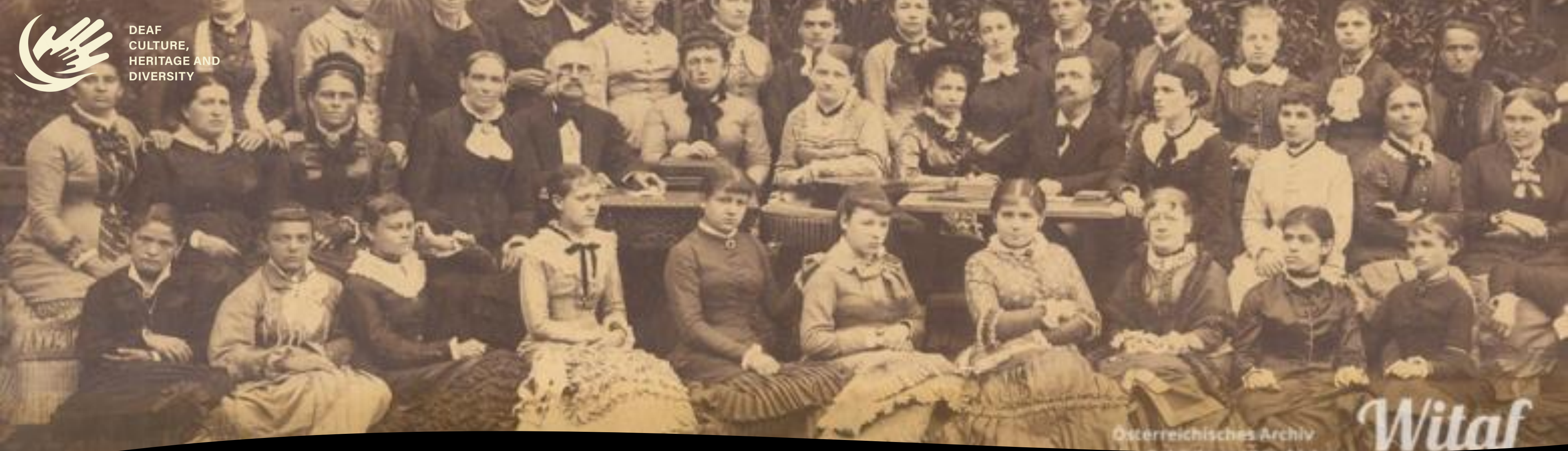
Wiener Taubstummten Frauen – Verein (1890)