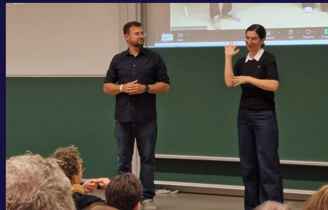
Congresso sull'educazione 2025 della Federazione Austriaca dei Sordi ("Gehörlosenbund")