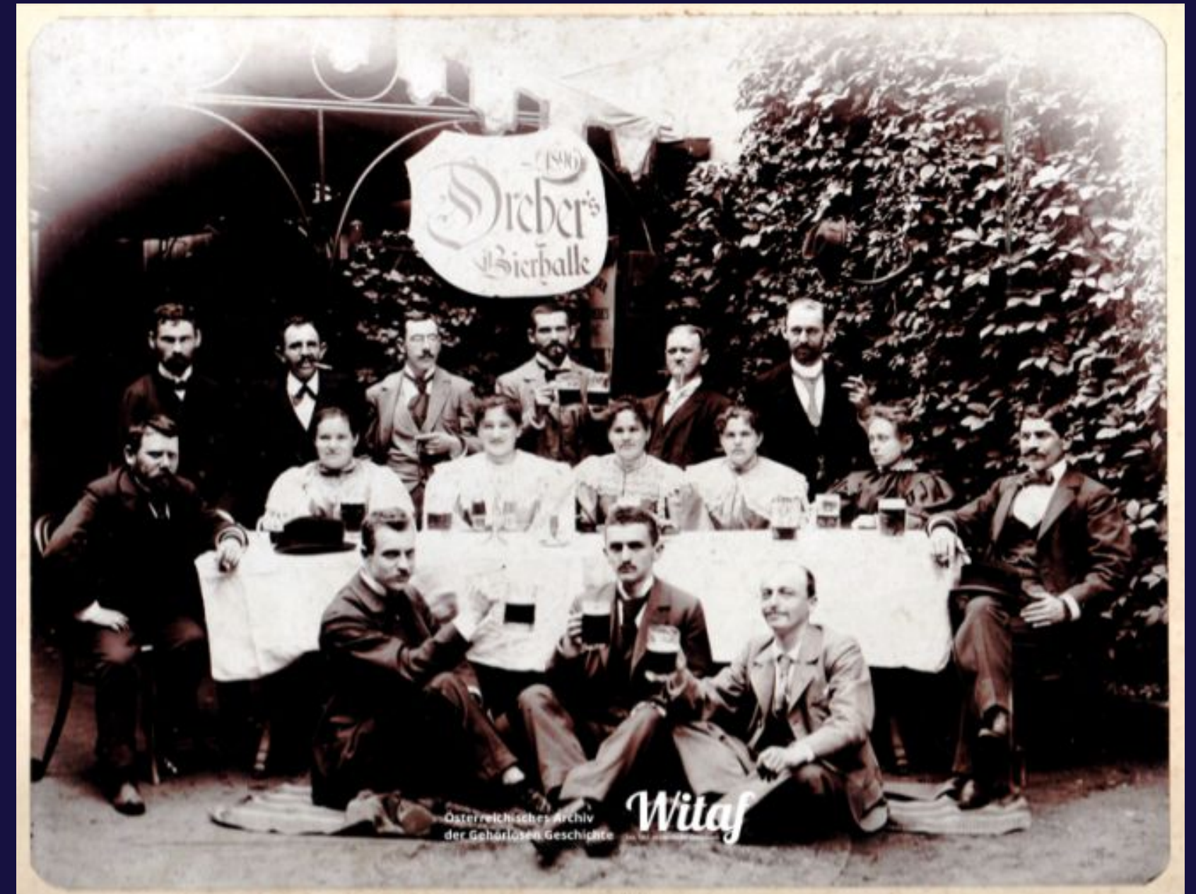
Società dei sordomuti presso la Dreher Bierhalle (1896)