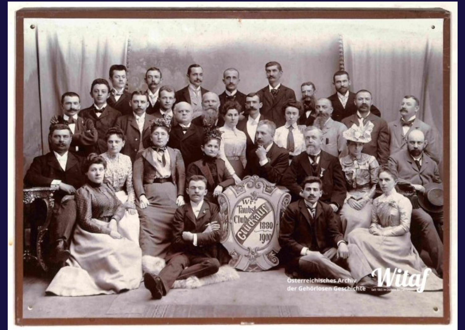
Wiener Taubstummen Club "Glück auf" 1880 - 1900, 20-jarig jubileumfeest