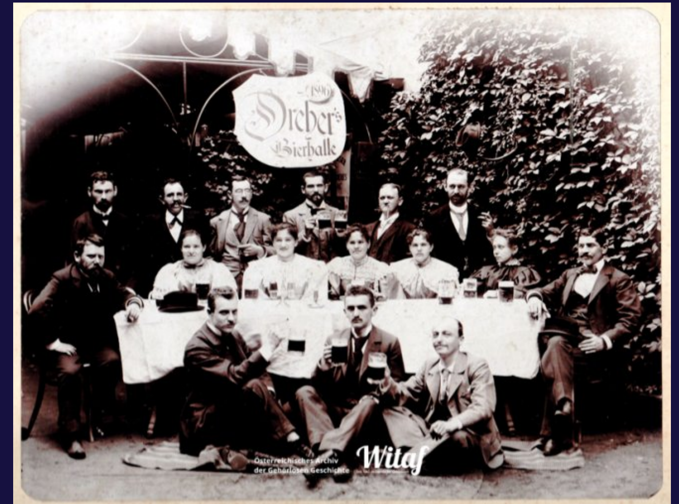
Taubstummengesellschaft bij de Dreher Bierhalle (1896) © Ludwig Pollak