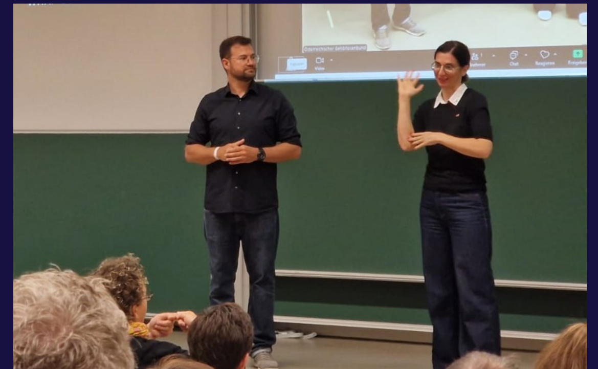
Educatief congres 2025 van de Oostenrijkse „Gehörlosenbund“