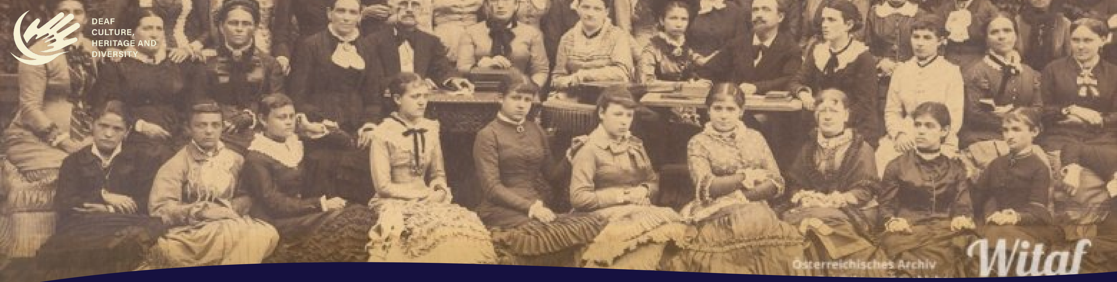
Wiener Taubstummen Frauen – Verein (1890)