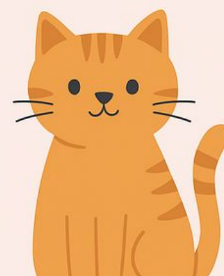
Obrázok 1 Obhajoba záujmov vs. aktivizmus [Diagram]. Z Advocacy vs. Activism , od Grammar Stammer, 2025. Získané 13. augusta 2025 z https://grammarstammer.weebly.com/words-i-o-the-wise/advocacy-vs-activism