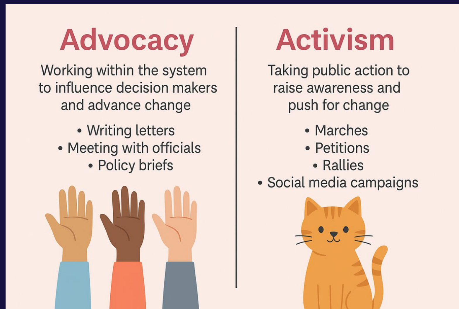
Figuur 1 Belangenbehartiging versus activisme [Diagram]. Uit Belangenbehartiging versus activisme , door Grammar Stammer, 2025. Op 13 augustus 2025 opgehaald van https://grammarstammer.weebly.com/words-to-the-wise/advocacy-vs-activism